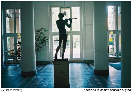
מחנך התערוכה "מנגינה גרמנית"